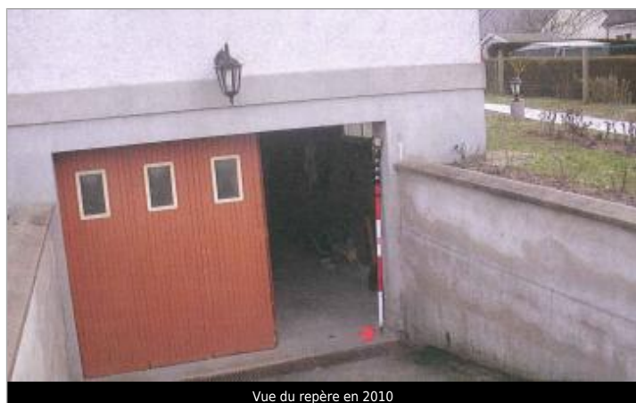
Vue du repère en 2010