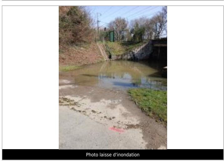
Photo laisse d'inondation

MARQUE Visibilité : Oui Pérennité : Moyenne