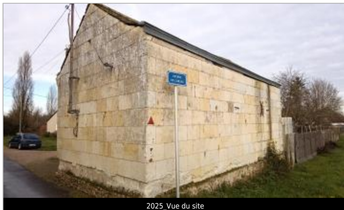
2025_Vue du site

Coordonnées WGS84 : X: -0.21656200 / Y: 47.44255530