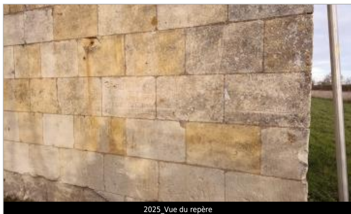
2025_Vue du repère