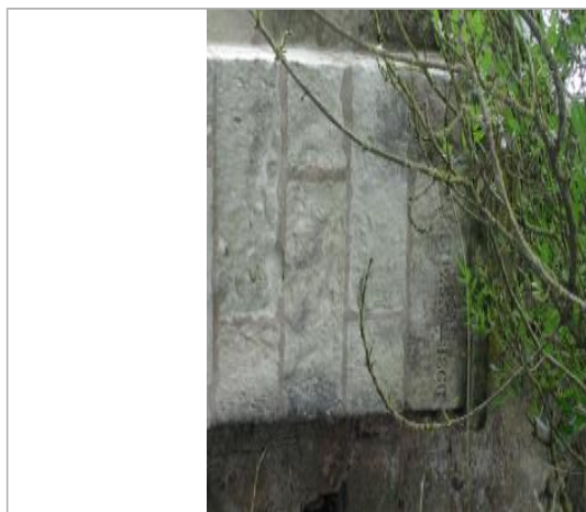
Vue détaillée du repère