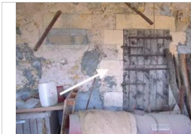
Vue du repère en 2003