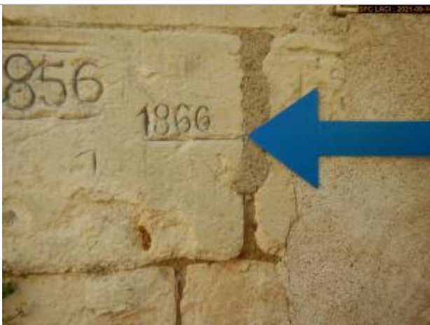
Vue du repère rapprochée en 2021

Système altimétrique : NGF IGN 1969 (système normal)