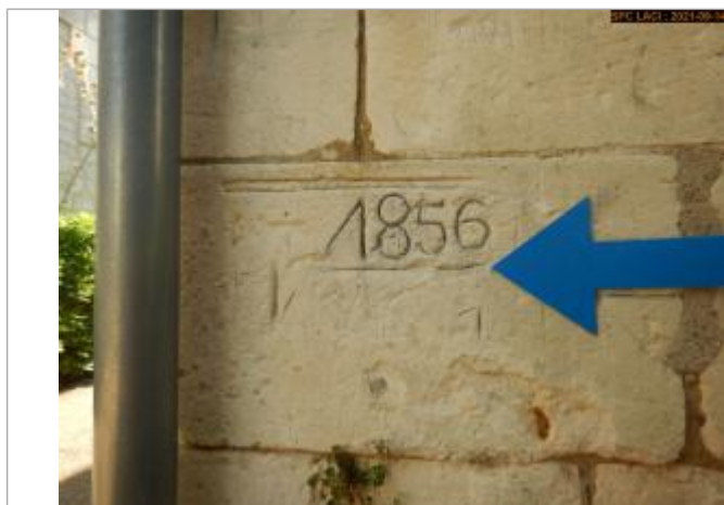
Vue du repère rapprochée en 2021