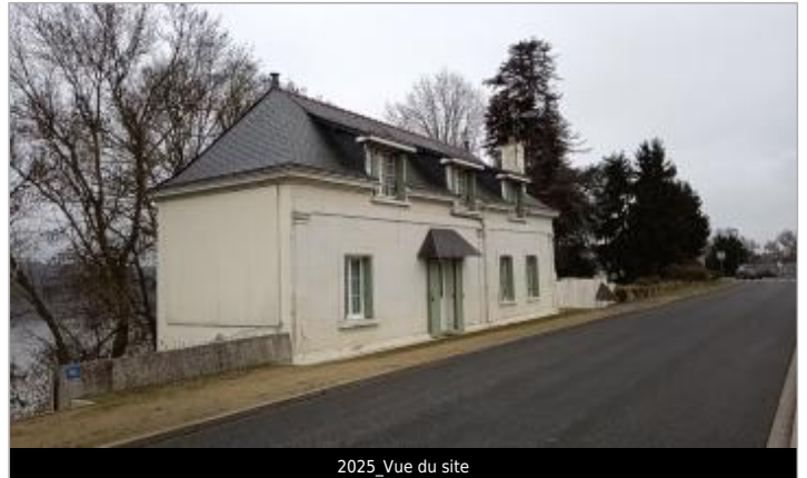
2025_Vue du site

Coordonnées WGS84 : X: -0.19787365 / Y: 47.33644400