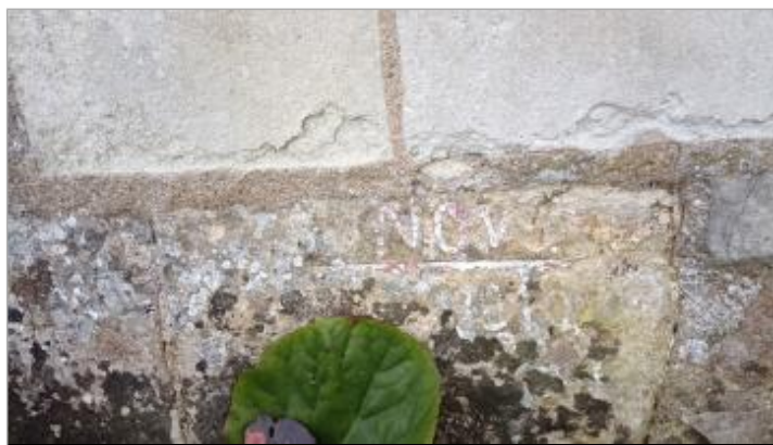
2025_Vue du repère