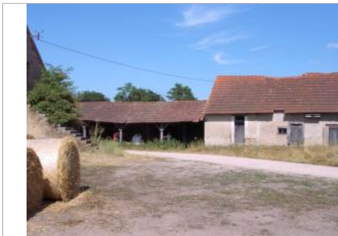
Vue du site en 2003