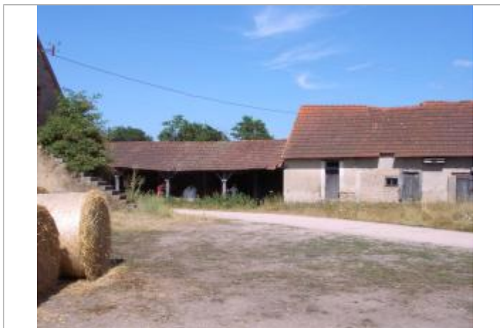
Vue du site en 2003