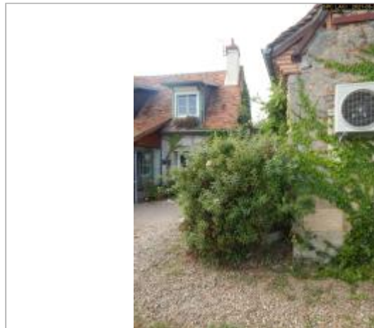
Vue du site de la crue de 1866