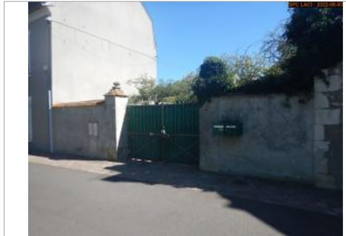
Vue du site éloignée (repère derrière ce portail)

Coordonnées WGS84 : X: 2.87241986 / Y: 47.52413370