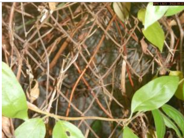
Vue du repère en 2022

Altitude calculée de l'eau (en m) : 139.215