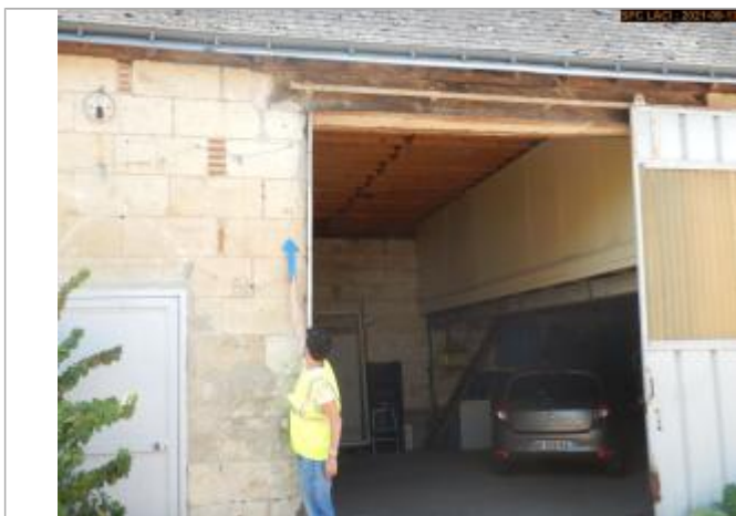
Vue du 1er repère à l'extérieur en 2021

Altitude calculée de l'eau (en m) : 46.5