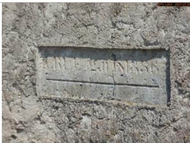
Vue du repère rapprochée en 2021

Altitude calculée de l'eau (en m) : 100.521