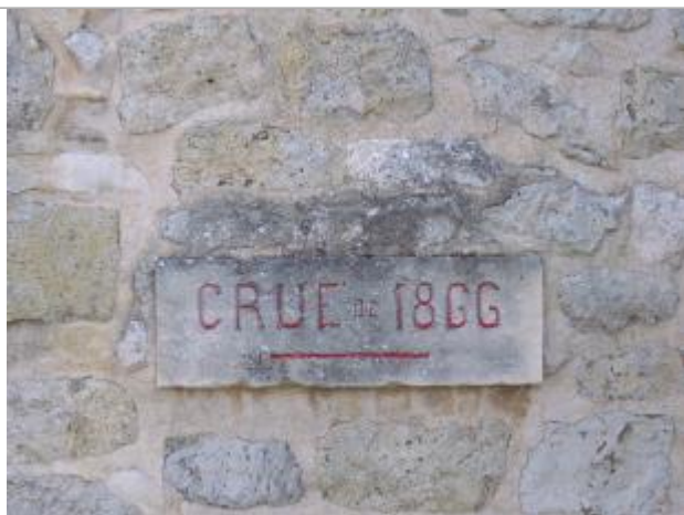
Vue de détail du repère

Altitude calculée de l'eau (en m) : 101.794