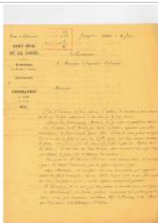
Réponse du conducteur M. Mérien du 4 juin 1856 page 1/2

Altitude calculée de l'eau (en m) : 100.01