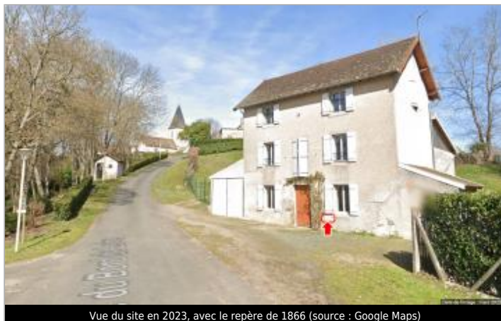
Vue du site en 2023, avec le repère de 1866