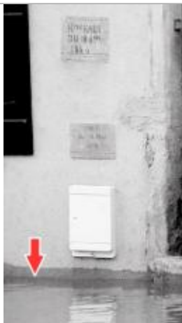
Photographie pendant la crue