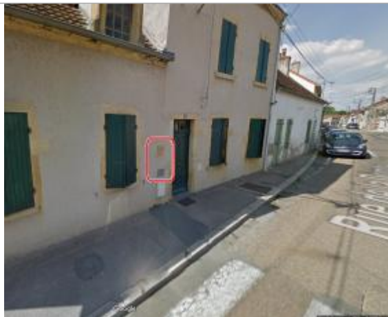
Vue du site en 2018

Coordonnées WGS84 : X: 3.97443530 / Y: 46.48125000