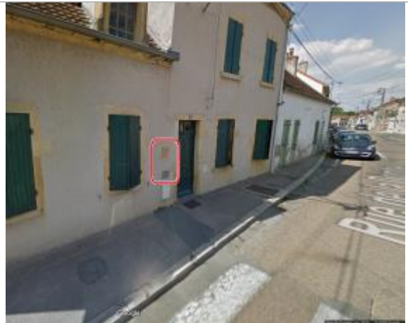
Vue du site en 2018

Coordonnées WGS84 : X: 3.97443530 / Y: 46.48125000