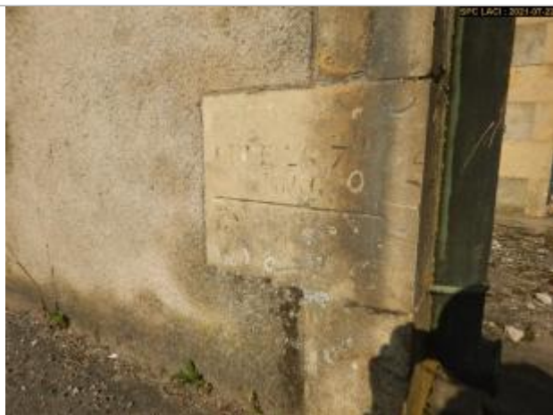
Vue du repère en 2021

Altitude calculée de l'eau (en m) : 192.59