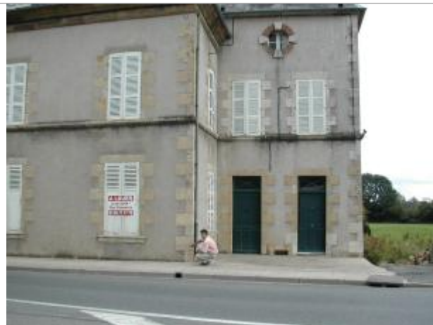
Photo du recensement d'origine en 2003