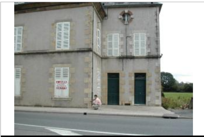
Photo du recensement d'origine en 2003

GÉOLOCALISATION Coordonnées WGS84 : X: 3.46666000 / Y: 46.83492800 Coordonnées RGF93 (Lambert 93) X: 735568 / Y: 6637302 Coordonnées RGF93 (ETRS89) : X: 3.46666 / Y: 46.834928 Code Hydro: ----0000 Rive de référence: Droite