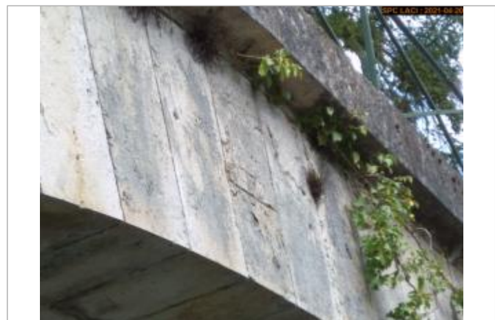
Vue du repère en 2021 milieu pont côté aval

GÉNÉRAL Code : LCI_R_712_1386 Date de mise à jour : 10/02/2022 Auteur : SPC LCI