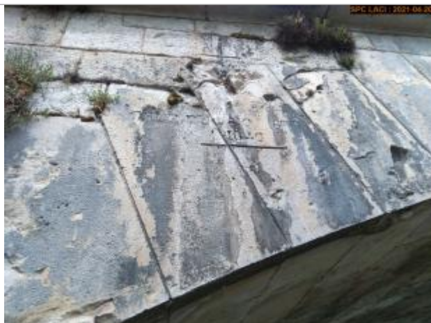
Vue du repère en 2021 début pont côté aval