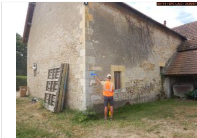
Vue du site en 2025