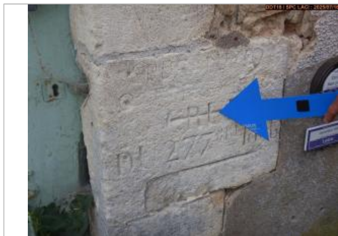
Vue du repère gravé (coté montant)

Altitude calculée de l'eau (en m) : 162.437