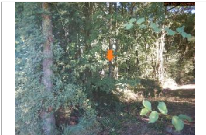
Vue du site éloignée (de la route)