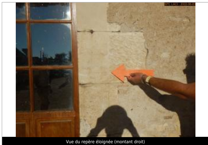
Vue du repère éloignée (montant droit)

Altitude calculée de l'eau (en m) : 142.75