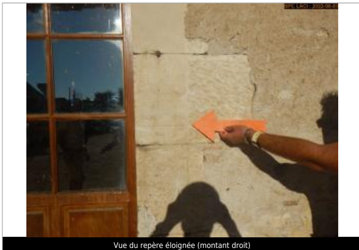
Vue du repère éloignée (montant droit)

Altitude calculée de l'eau (en m) : 142.75