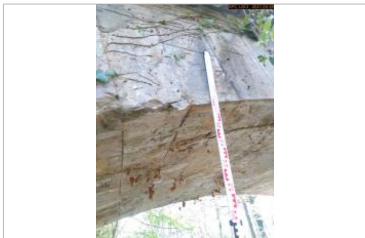
Vue du repère en 2021 milieu pont côté aval