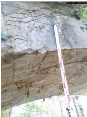
Vue du repère en 2021 milieu pont côté aval

Altitude calculée de l'eau (en m) : 133.61