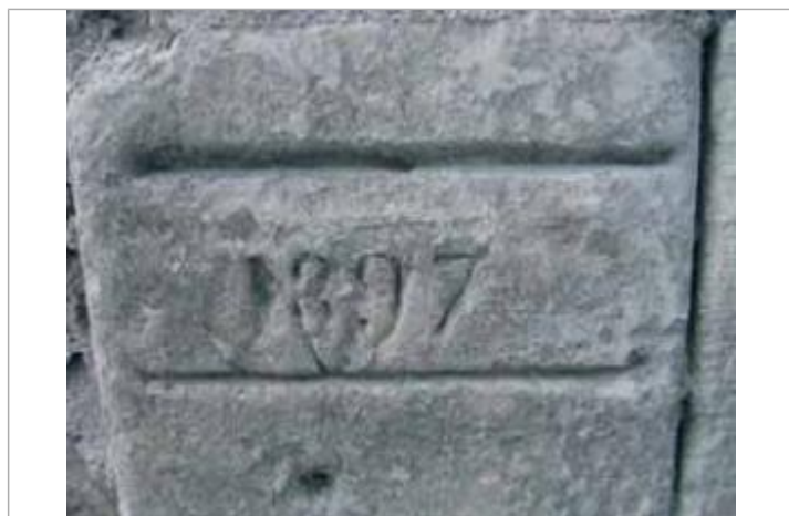
2001_Vue du repère

Altitude calculée de l'eau (en m) : 17.34