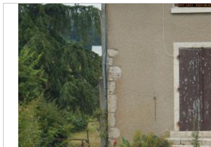
Vue du repère en 2021