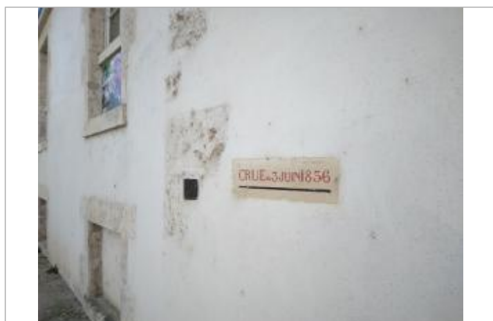
Photo du repère en 2022