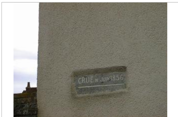
Vue de détail du repère

Code : LCI_R_354_842 Date de mise à jour : 31/05/2018 Auteur : SPC LCI