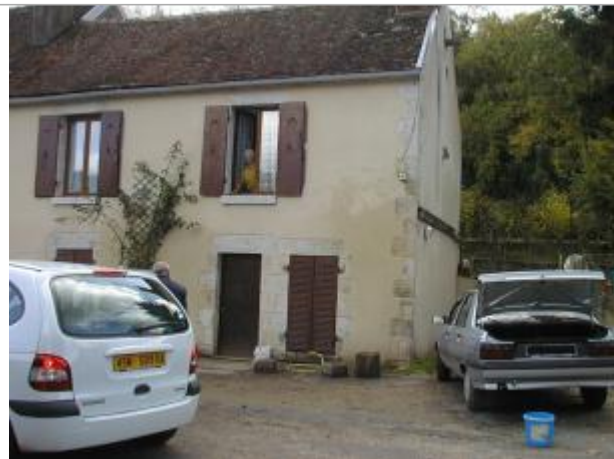
Photo du recensement d'origine en 2003