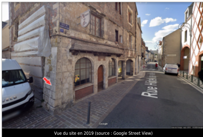
Vue du site en 2019