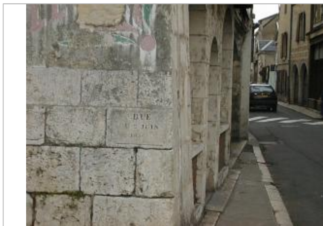
Vue du repère (recensement d'origine)

Altitude calculée de l'eau (en m) : 127.746