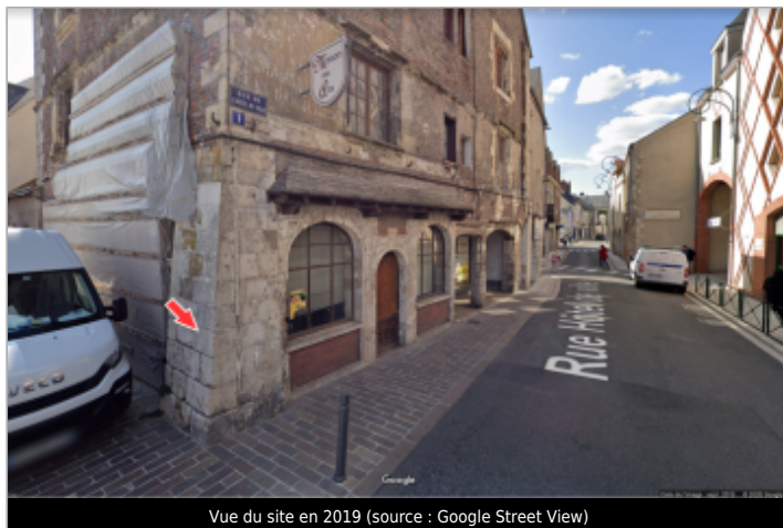
Vue du site en 2019