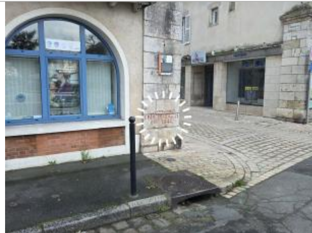
Photo du site et des deux repères historiques, décembre 2025.