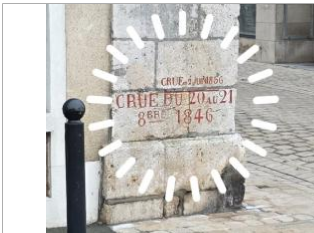
Vue rapprochée des deux repères historiques de 1846 et 1856, photo prise le 15 décembre 2025.