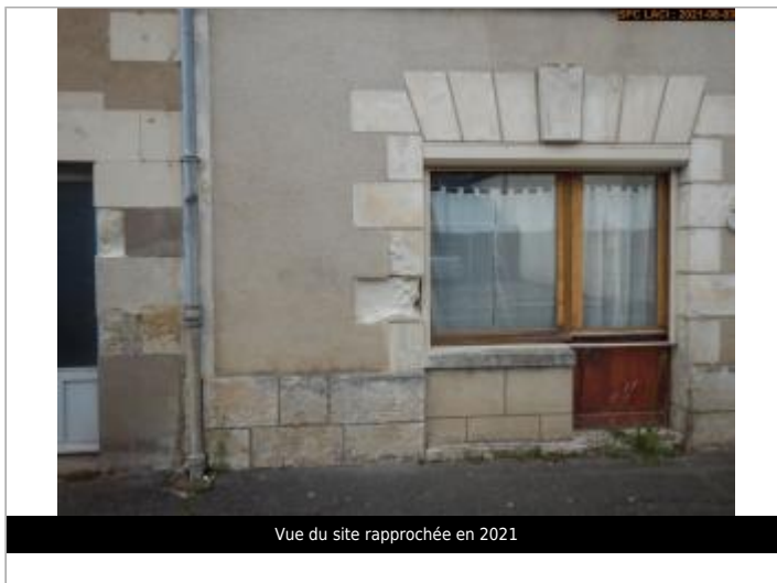
Vue du site rapprochée en 2021