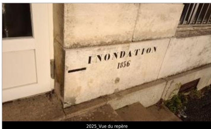
2025_Vue du repère