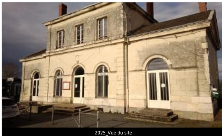
2025_Vue du site