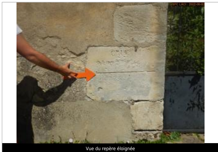
Vue du repère éloignée

Altitude calculée de l'eau (en m) : 153.95