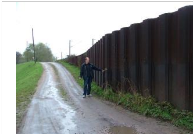
Archive Navigation du Nord Est