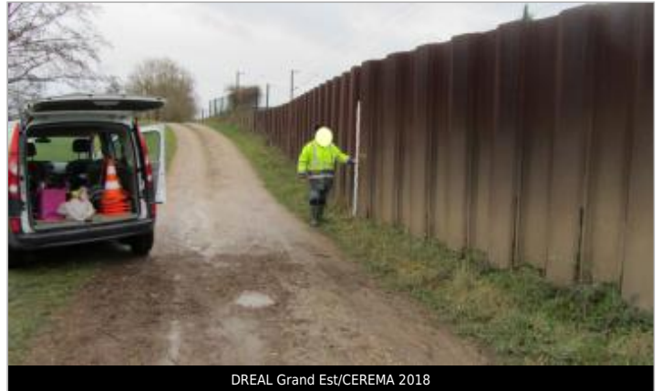
DREAL Grand Est/CEREMA 2018