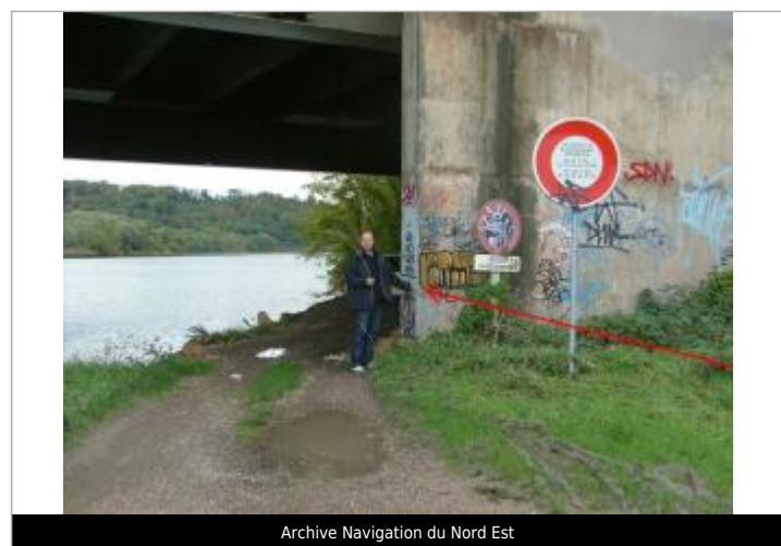
Archive Navigation du Nord Est