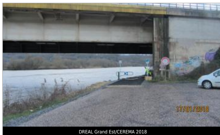
DREAL Grand Est/CEREMA 2018