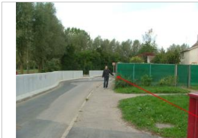
Photo Repères de crue (Site)