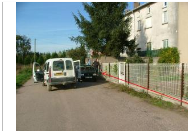
Photo Repères de crue (Site)