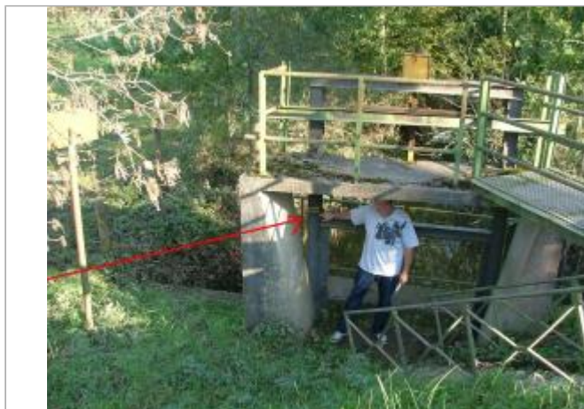
Photo Repères de crue (Site)