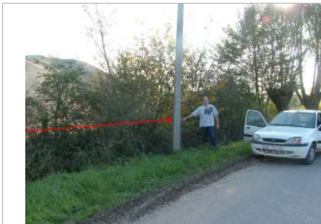
Photo Repères de crue (Site) - Auteur : Archive Navigation Nord Est