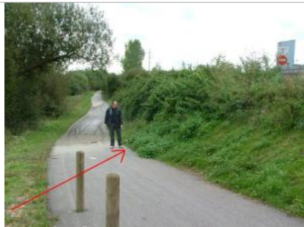
Photo Repères de crue (Site)

Coordonnées WGS84 : X: 6.15113000 / Y: 48.75300000