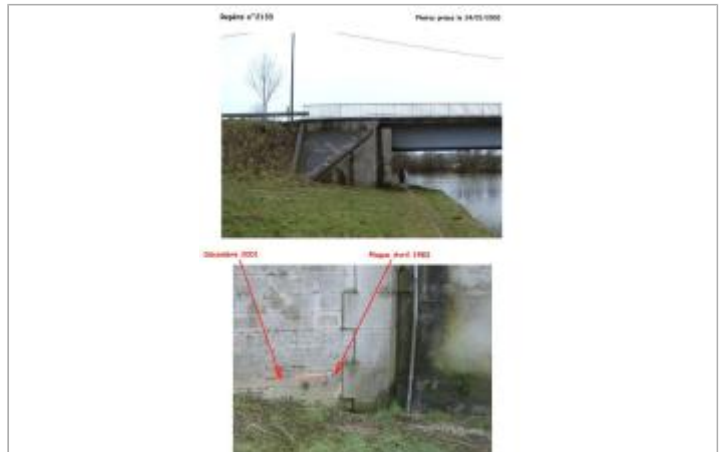
Photo Repères de crue (Site)

Coordonnées WGS84 : X: 5.37646000 / Y: 49.14950000