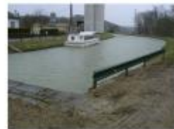
Photo Repères de crue (Site)