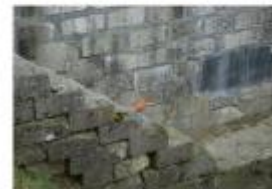
Photo Repères de crue (Site) - Auteur : Archive Navigation Nord Est