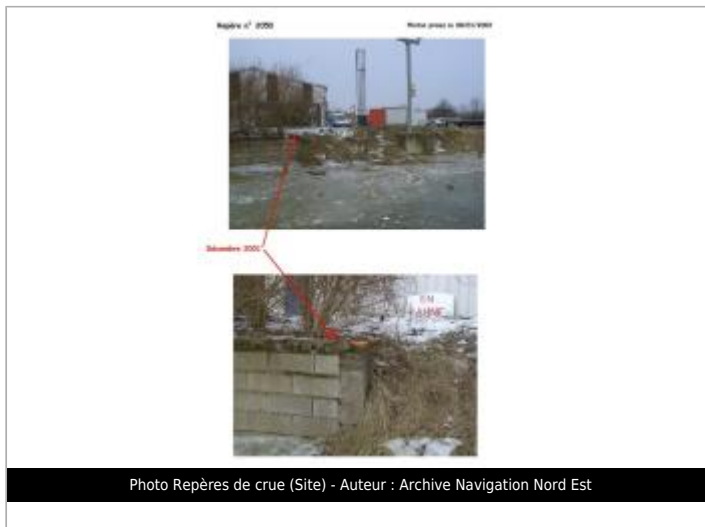
Photo Repères de crue (Site)