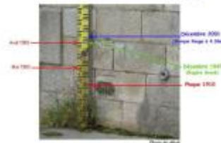
Photo Repères de crue (Site)