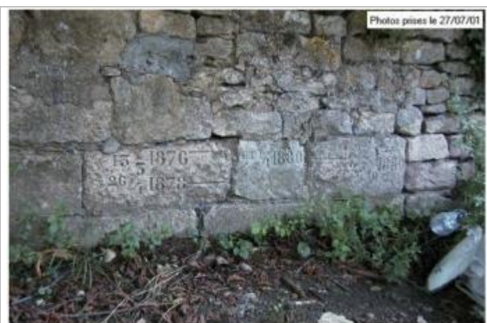
Photo Repères de crue (Site) - Auteur : Archive Navigation Nord Est