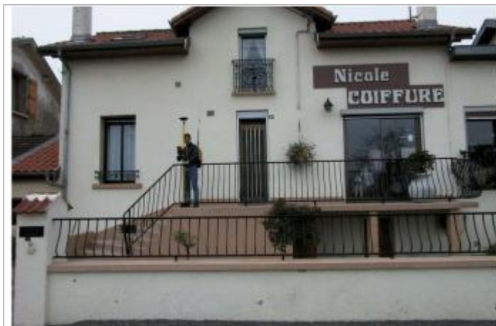
Photo Repères de crue (Site)