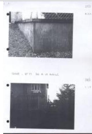
Photo Repères de crue (Site)