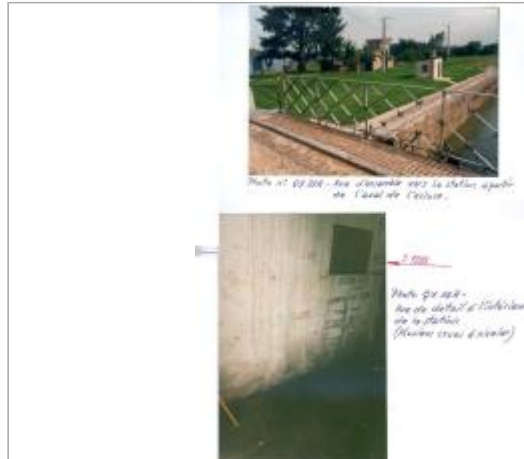
Photo Repères de crue (Site)

Coordonnées WGS84 : X: 4.82980000 / Y: 49.69390000